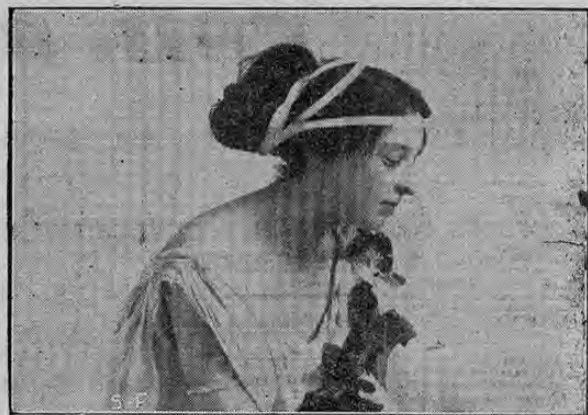
Señorita Geneveva Santi

célebre bailarina que ejecuta las clásicas danzas griegas y otras de fantasía, entre las q' figura la emocionante "Danza de la Muerte."